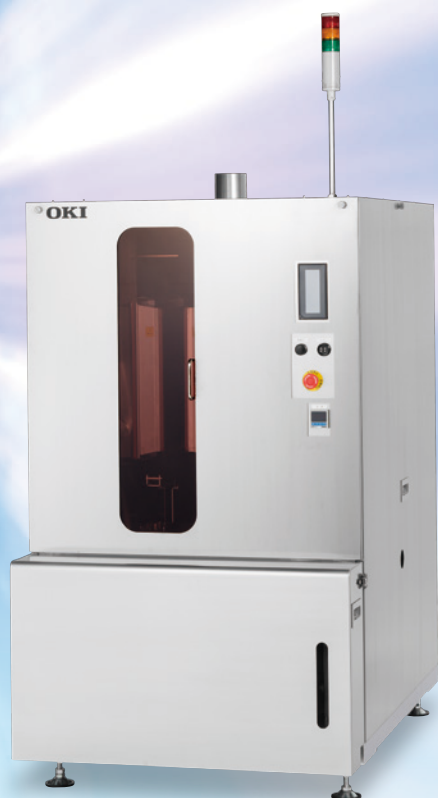
ACT100M メタルマスク専用