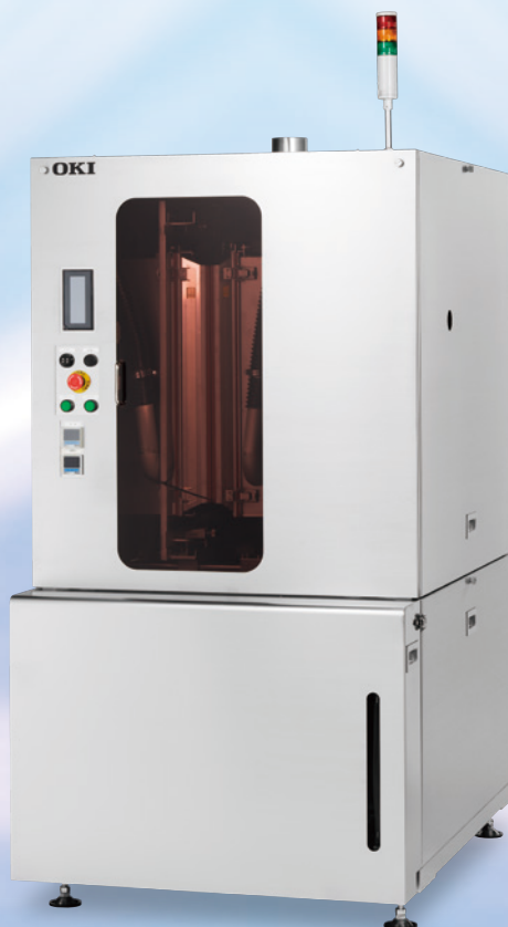
ACT200/300 シリーズ 微細線対応洗浄装置