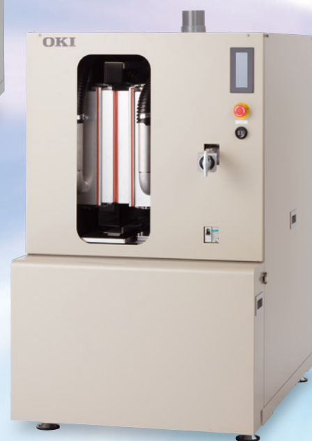
ACT100Lite SMTメタルマスク専用